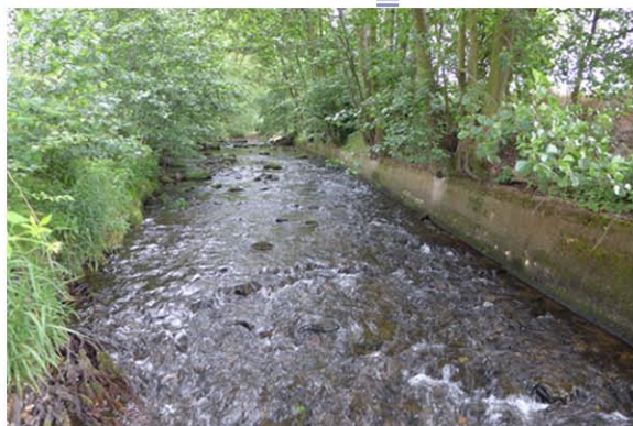
Die Nieste im Bereich des Gemeindezentrums vor (linkes Bild) und kurz nach der Renaturierungsmaßnahme (unten).