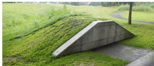
oben: Anschlussgiebel am Übergang von der Verwaltung zu den mobilen HW-Schutzelementen